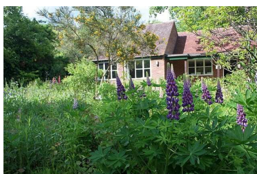
Schulungsraum im Bach Centre